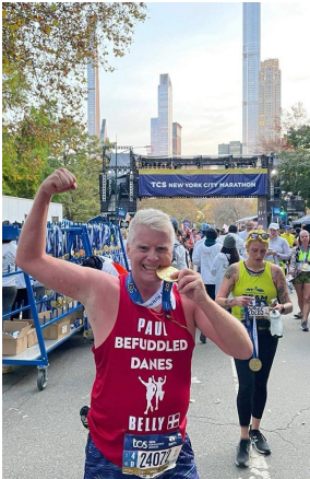
NYC Marathon, 2021

Det sværeste ved at flytte er naturligvis det afsavn, vi har til vores 2 voksne piger, familie og