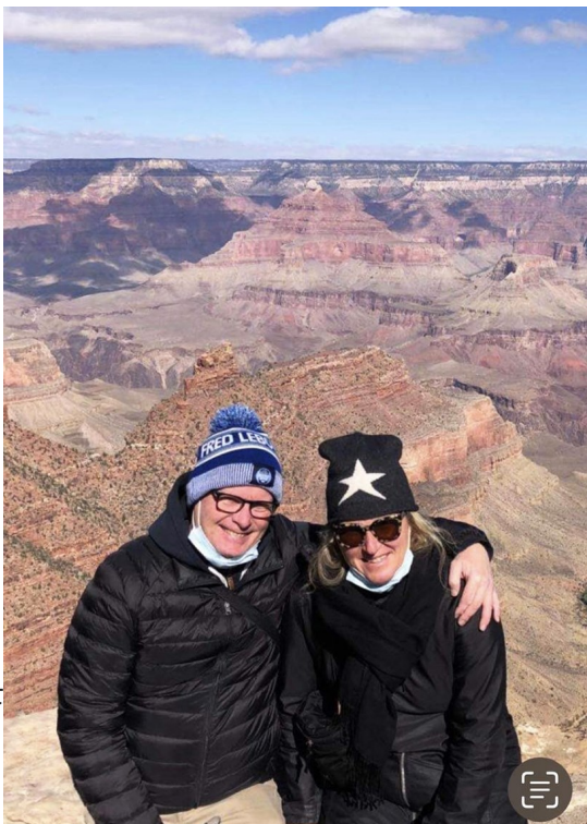
Grand Canyon, Arizona, 2020

bedre løsning på affaldssituationen i NYC (genbrug/recycle mv.).