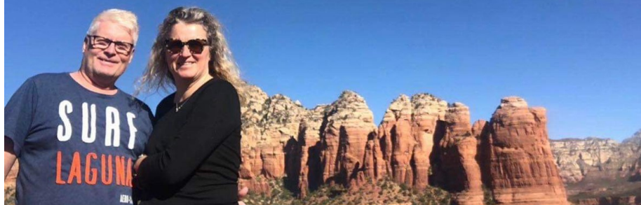
Sedona, Arizona, 2020