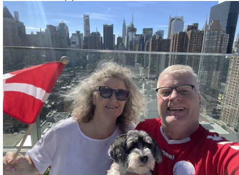
Klar til landskamp på Sidedoor med hunden Amanda, 2024

1985-86, hvor jeg arbejdede som trainee i en interesseorganisation i Fergus Falls. Mine forældre bosatte sig i Minneapolis i 1986, hvor de startede egen virksomhed (rejsebureauet Kristensen International Travel & Tours - tidligere HHK Travel), så vi har regelmæssigt været på besøg i USA, når vi har besøgt mine forældre og min søster og hendes familie, som bor i Saskatchewan, Canada. Det var derfor ikke svært at slå til, da jobbet i New York blev tilbudt!