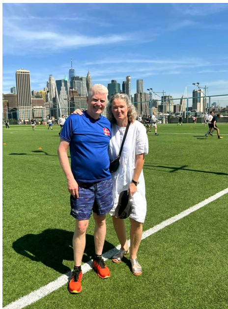
Sømandskirkecup på Pier 5, 2024