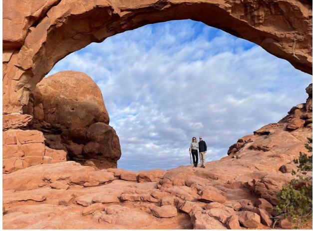
Arches National Park, Utah, 2021

venner. De venskaber vi har fået i de 22 år, vi har boet i udlandet (Singapore, Belgien, Schweiz, Kina og nu USA) skal også plejes og holdes ved