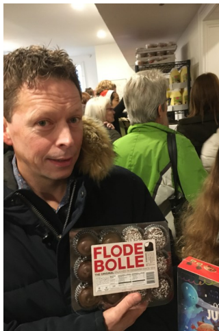
Første julemarkedet 2018