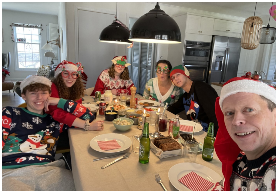
Endelig sammen til jul igen efter covid 2021

Jeg kan godt savne Danmark ind imellem og det er primært savnet af børn, familie eller bekendte man sidder og savner. Det kan også være maden, menneskene eller blot det lille dejlige land jeg nogle gange savner meget.