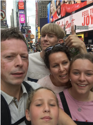
Times Square 2016