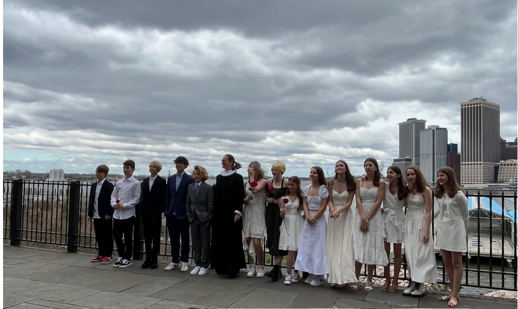
Konfirmation for 14 fine konfirmander 10. april 2022. Og billeder fra konfirmandweekend i marts måned.