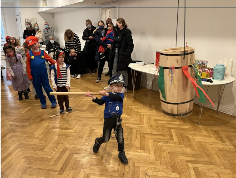
Fastelavns gudstjeneste og tøndeslagning i februar måned.

I februar måned kunne Mødregruppen fejre 10 års fødselsdag. Siden februar 2012 har den været et fast holdepunkt for mange gravide og nybagte forældre, hvor man kan møde andre og snakke om hvordan det er at være dansk forælder i New York.